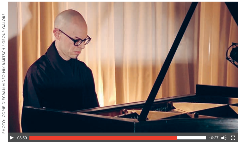
Le pianiste de jazz et producteur de musique zurichois Nik Bärtsch a joué son œuvre «Modul 5» pour la série SUISA «Music for Tomorrow».