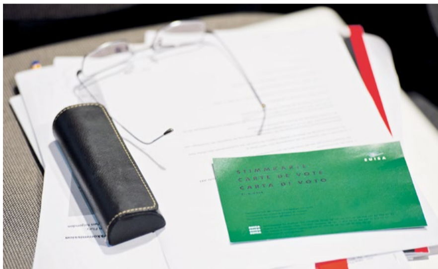
Die Generalversammlung 2020 der SUISA wird ausnahmsweise auf brieflichem Weg durchgeführt.