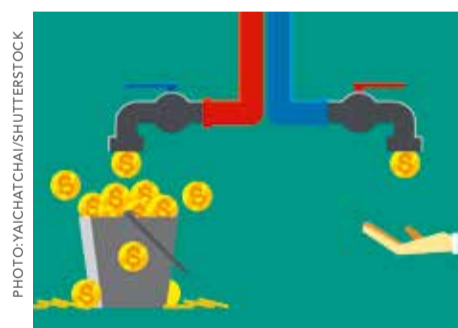
La loi sur le droit d'auteur nécessite au plus vite des réglementations relatives à l'utilisation en ligne d'œuvres protégées par le droit d'auteur.

Le Conseil fédéral a adopté le message relatif à la nouvelle loi sur le droit d'auteur. SUISA est globalement satisfaite de cette version de la loi.