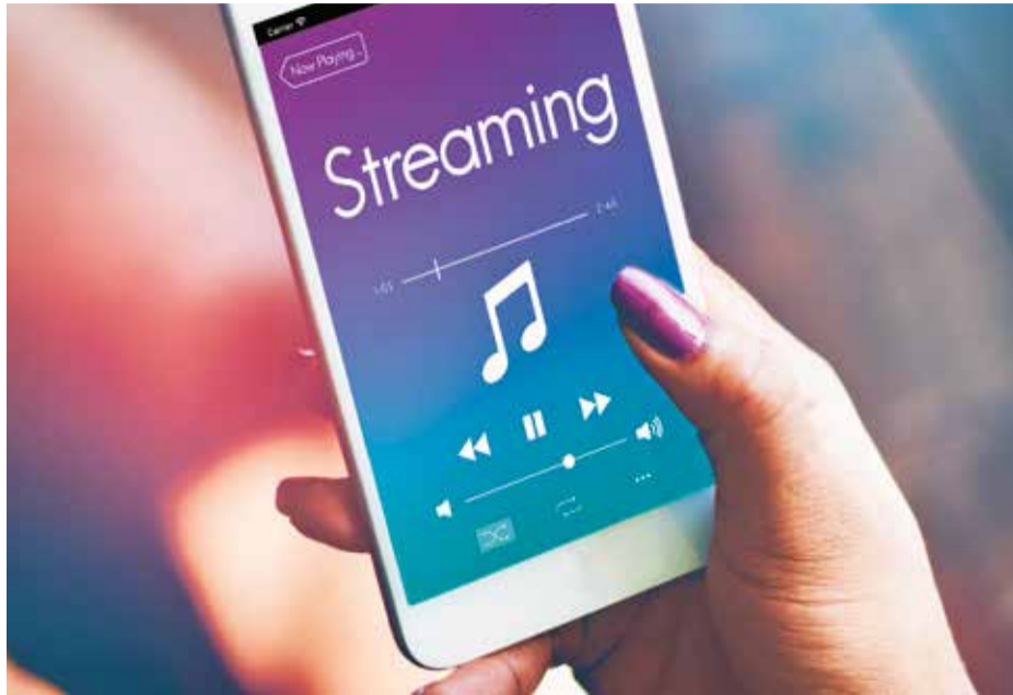
SUISA modifie ses clés de répartition pour les recettes provenant du streaming et des téléchargements.

De nouvelles clés de répartition seront appliquées pour la répartition des recettes provenant des utilisations sur Internet (offres «on demand» audio et vidéo). Pour le téléchargement, la clé de répartition suivante sera appliquée: 25% pour les droits d'exécution et 75% pour les droits de reproduction. Pour le streaming, elle sera de 75% pour les droits d'exécution et 25% pour les droits de reproduction.