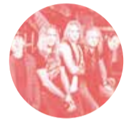
Gotthard, Groupe de rock

«Cette initiative menace la création musicale et la diffusion des artistes suisses. Pour que le public puisse continuer à découvrir et à apprécier la musique romande et suisse, le maintien des radios et télévisions est primordial.»